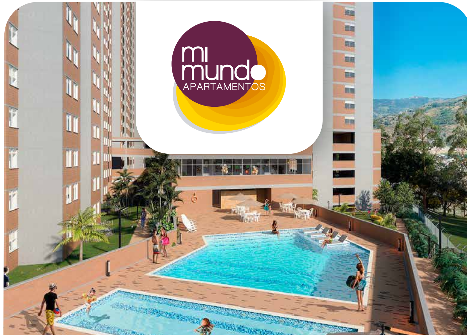
Puerta del Norte